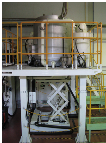
ラジカル窒化装置