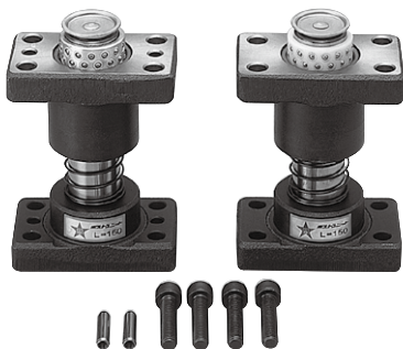
PYAP(ノック穴付アルミボールブシュ) PYJP(ノック穴付樹脂ボールブシュ)